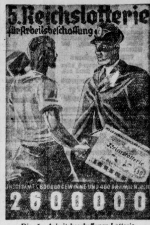
Die 5. Arbeitsbeschaffungs-Lotterie