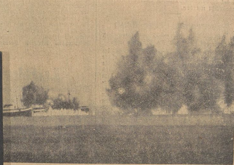
Luftangriffe mit scharfen Bomben auf Zielschiffe. In der italienischen Luftwaffe erhielten dadurch eine besondere Note, daß meist Zerstörer vorgelassen wurden. Unser Bild zeigt Bombeneinschläge auf Schiffe.

Die Italienreise des Führers, die Besprechungen, die in Rom gepflogen wurden, bekräftigen einen Zusammenhang, dessen Geheiß in die politische Harmonielehre des neuen Europas als Lebensaufgabe aufgenommen werden.