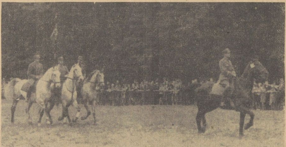
Einmarsch der Turnierteilnehmer zu den Wettkämpfen am Sonntag.

Die Eignungsprüfung für Wagenpferde im Einpänner- und Zweipännerzug war besonders eine Angelegenheit, die auch unsere bürgerliche Bevölkerung lebhaft interessierte, doch hatte jeder Pferdebesitzer seine Freude an dieser schönen Vorführung. Das Gruppenpringen der SA, ein Fahrer und zwei Reiter, sowie das abfolgende Geborsampringen war ein schöner Ausklang des Tages, der noch durch die Schannung der Reiterfahre Spindler würdevoll und unterhaltsam beendet wurde. Bei einem Reiterball im „Rathshaus“ wurden den Siegern schöne Preise, die zum größten Teil aus Erlöseungen