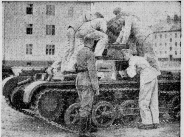
Die Rekruten beim Panzer-Regiment betrachten ihre neue Waffe. Die Rekruten des Panzer-Regiments Nr. 5 in Wunsdorf benutzen schon an ihrem Einstellungs-tage die ersten freien Minuten, um sich ihre neue Waffe anzusehen.