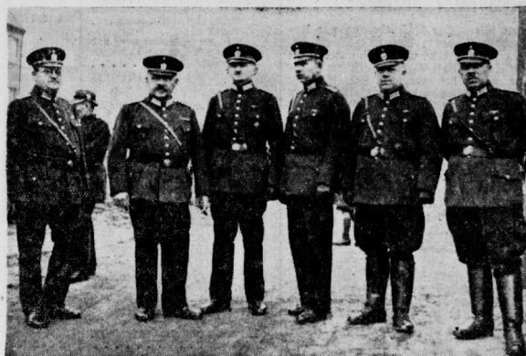
Der Führerstab der Freiwilligen Feuerwehr Merseburg.

Zu den schönsten Beweisen jener ungeliebter und fegefeuerter Mitleidenschaft gehört die Tätigkeit einer freiwilligen Feuerwehr, eine der ältesten Einrichtungen, die schon seit Jahrzehnten unbewußt im nationalsozialistischen Sinne gearbeitet haben. Dar doch in dieser Organisation der Gedanke des Gemeinwohls und der Volksgemeinschaft ausstrahlend, so daß von den Mitgliedern der Feuerwehr seit jeder beträchtliche Opfer an Zeit, Geld, Gesundheit und Leben gebracht worden sind und noch gebracht werden. Auch in dem während früherer Jahrhunderte oft furchtbar durch verheerende Feuerbrünste heimgeführten Merseburg beteiligt sich seit langem in dieser Gestalt der Gemeinwesen 70 Jahre hindurch, weil unsere Stadt eine wohlgeordnete freiwillige Feuerwehr besitzt. Unsere Pflicht ist es, heute dankbar daran zu denken, denen wir ihr Ergehen und Gedeihen verdanken. Ueber die