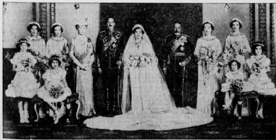
Nach der Hochzeit im englischen Königshaus. In der Privatkapelle des Buckingham-Palastes zu London wurde am Mittwoch der Herzog von Gloucester, der dritte Sohn des Königs von England, mit der Herzogin Lady Alice Scott getraut. Unser Bild zeigt das Brautpaar mit dem König und der Königin von England nach der Trauung.

Unter der Überschrift „Deutschland und Sanktionen“ schreibt die „Deutsche diplomatische politische Korrespondenz“: Die Haltung Deutschlands in dieser kritischen Stunde ergibt sich folgerichtig aus seiner völkerrechtlichen Sonderlage ebenso wie aus den Grundfäden der deutschen Friedenspolitik und der pflichtgemäßen Verantwortung gegenüber dem eigenen Volk. Daß Deutschland keine Verletzung hat, hat sich dem in Genf beschlossene Verfahren anschließen, ist nur die Konsequenz aus seiner Nichtangehörigkeit zu dem Genfer Gremium. In Übereinstimmung mit den Grundfäden seiner Friedenspolitik muß Deutschland andererseits aber auch alles ablehnen, was es in Widerspruch zu seinem unbedingten Friedenswillen bringen und zur Verschärfung der Situation beitragen könnte. Aus diesen Erwägungen heraus lehnt Deutschland für seinen Teil auch die Rolle des Kriegsgemittels als unvereinbar mit einer verantwortungsbewussten und von der Sorge um den Frieden bestimmten Politik ab. Es kann andererseits aber auch nicht zulassen, das Opfer mittelbarer und unmittelbarer Rückwirkungen zu werden, mit denen es nicht zu tun hat und die außerhalb seiner Verantwortung liegen. Deutschland hat in dem gegenwärtigen Streitfall von Anfang an eine strikt unbeteiligte Haltung eingenommen und sieht sich in jeder Weise innerhalb eines Konfliktes, an dem es weder verantwortlich ist noch irgendeine Verantwortung übernommen hat.