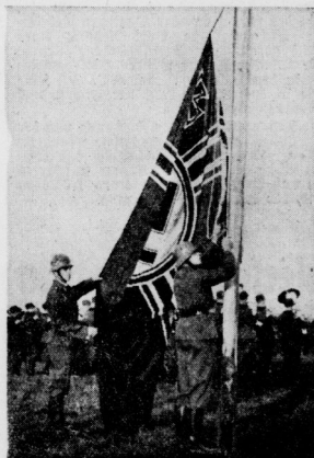
Die neue Reichskriegsflagge steigt empor.