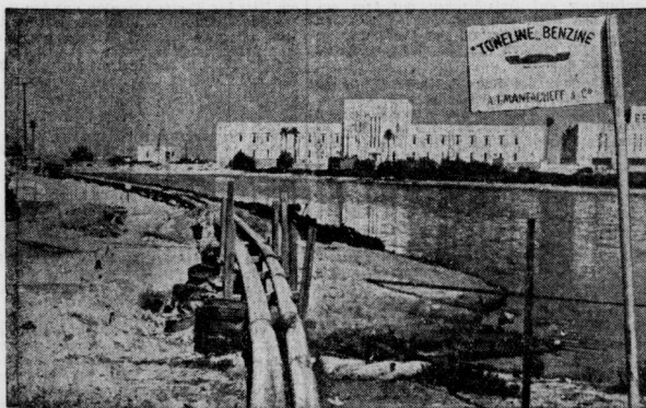
Der Kampf um Öl im Mittelmeer.

In der abessinischen Hauptstadt sieht man den kommenden Tagen mit größter Spannung entgegen. Sie sollen die große abessinische Offensive bringen, deren Verlauf der Kaiser nach Delfie abgewartet war. Der Angriff soll mit einem Schloß an allen Frontabschnitten losgehen. Der militärische Berater