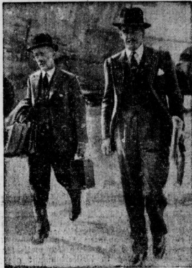
Anthony Eden (rechts). (Spezial-Blatt)

Griechenland sei ernstlich worden, im Notfall nicht nur Kriegsschiffe zu senden, sondern auch der britischen Flotte die Benutzung des Hafens Suvanto und des Hafens von Kreta zu ermöglichen. Der britische Vertreter in Athen habe mehrere Besprechungen mit dem griechischen Ministerpräsidenten gehabt. Dieser habe erklärt, er sei entschlossen, sich genau an die Völkerbundsverpflichtungen zu halten. Die Türkei und Jugoslawien seien bereit, ihre Verpflichtungen durch Entsendung von Kriegsschiffen und Soldaten zu erfüllen. Die Fischeinwanderung habe angefangen, sich bereitzustellen, ebenso Rumänien. Die Türkei habe die Frage der entmilitarisierten Zone an den Dardanellen aufgeworfen, aber keine Vorarbeiten hinsichtlich ihrer Beseitigung gemacht. Zwischen dem französischen und dem britischen Admiralstab seien bereits Besprechungen über französische Stille im Mittelmeer und Benutzung französischer Flottenstützpunkte durch britische Kriegsschiffe geführt worden.