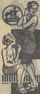
Die ideale Hanna- Unterkleidung aus reiner, weicher Wolle

Kübler-Kleidung in allen Formen und Farben zu Originalpreisen!