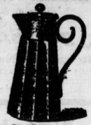
Saftkanne geschliffen m. Nidelfuß Stück 1,00 Mk.