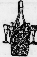
Likörservice in Form eines Weinküblers mit Champagnerflasche und Gläsern. Großart. Geschenk Stück 3,00 Mk.