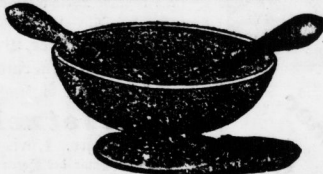
Salatschüsseln Majolika mit Besteck Stück 3,00 Mk.