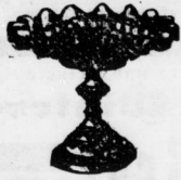
Fruchtschalen mit Nidelfuß Stück 1,50, Alfenidefuß Stück 3,00 Mk.