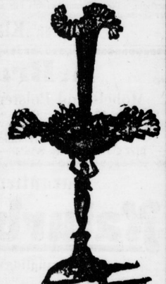
Tafelaufsatz geschmückte Majolika, Silber, Stück 2,25 3,00, 3,50, 4,50 bis 12 Mk.