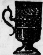
Theoglashalter mit Glas Stück 1,00, 1,50, 3,00.