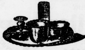
Nickel-Rauchservice Stück 1,00, 2,25, und 3,00 Mk.