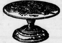
Tortenplatte mit Majolika-Ein- lage und Nidelfuß Stück 3,00 Mk.