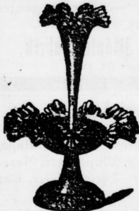
Tafel-Aufsatz Stück 1,00, 1,50, 2,50, wie Abbild. St. 2,25 u. 3 Mk. Große Alfenide- Aufsätze bis 20 Mk.