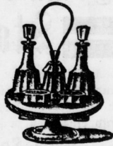
Menage für Essig, Oel, Senf, Salz u. Pfeffer Stück 1,00, 3,00, 3,50, 4,00 bis 6,00 Mk.

Erstes u. grösstes Magazin für vortheilhaften Weihnachts-Einkauf.