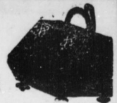
Kohlenkasten A 2.50 Mk.

Deutschlands größtes Spezial-Geschäft. Erstes Geschäft: Leipzigerstr., am Turm. Zweites Geschäft: Oleariusstr., am Ballmarkt. Fernr. 1226 Mitglied des Rabatt-Spar-Vereins Fernr. 1226