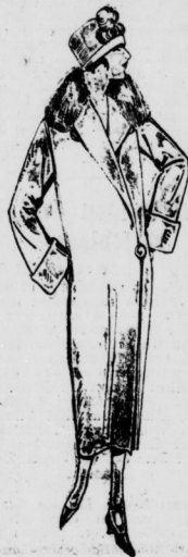
Flotter Velour-Flaansch-Mantel mit Pelzkragen. It. Bild offen und geschlossen zu tragen 24 75

It. Bild, aus warmen melierten Winterstoffen. Dieselbe Form in weicher, molliger, bellkar. Flausschw. 15 75