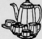
Kaffeeservice, 8tlg., bestehend aus Kaffeekanne, Zuckerdose mit Deckel, Milchgießer, 1 Ober- u. 1 Untertasse. . . . . 95 Pfg.

Springform, groß, extr. et Messerkorb, m. stark. Gaze Stellig Kartoffelpresse Melonenform Universaltisch, mit 8 aus- wechselbaren Böden