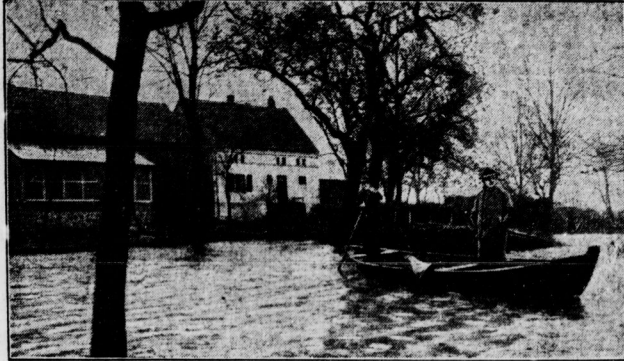
Ein Schuß in Lübenstede, vom Sodawasser der Elbe so vollständig umspült, daß sich der Verkehr nur noch auf Rädern vollzieht.