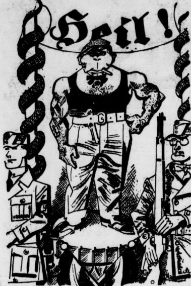
Die Wölfschen haben den Stensdorfer Schmelter sen. zum Ehrenmitglied ernannt. Weitere Ernennungen werden unmittelbar bevor.