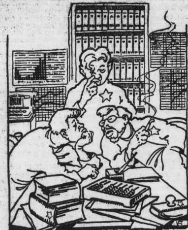
"Mit Recht sind die deutschen Ingenieure eingesperrt. Wo müssen sie sich in unsere Angelegenheiten, die Cabotage der Industrie ist doch unsere Aufgabe!"