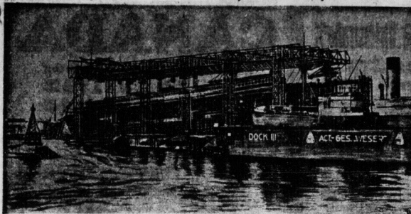
Wir zeigen heute nach unserer früheren Berichterstattung im Unterhaltungsteil noch einmal die "Bremen" auf der Werft in Bremen. Der Stapellauf findet heute am 14. August statt.