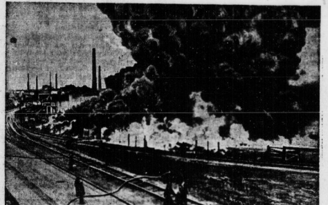
Unsere Aufnahme zeigt die Brandstelle, etwa eine halbe Stunde nach Ausbruch des Feuers. Dichte Rauchwolken, die durch Verbrennen von Holz, Terpentin usw. entstanden, steigen zum Himmel auf und machen eine Annäherung der Feuerwehre unmöglich.

Wie in Hamburg bekannt, wird von den großen Hamburger Versicherungsanstalten, bei denen die Lagerhausgesellschaft in Wilhelmsburg versichert war, die Zahlung der Entschädigungssumme abgelehnt. Die Versicherungsanstalten behaupten, daß eine solche Zahlung der Hamburger Feuerwehren den Millionen Schaden erheblich vermindern würde.