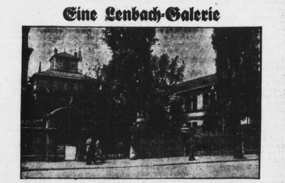
wurde in Wänden eingericht. In dem Haus, das der vor 25 Jahren verlorene Meister Lenbach bewohnte, hat die Stadt die neu geschaffene Gemäldesammlung untergebracht.

Der tote Dichter im Austerntwagen. Zum 25. Todestage Tschadow's - Ein Bewunderer deutscher Kultur - Die letzten Worte eines russischen Dichters: ein deutscher Satz!