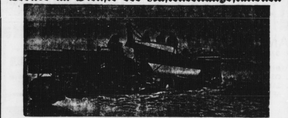
Ein der englischen Küste wurde erstmalig für eine Küstenrettungsstation ein Motorboot im Betrieb gefehlt, der sich sehr bewährt hat.