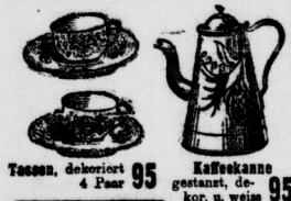
Tassen, dekoriert 4 Paar 95 Kaffeekanne gestanz., dek. u. weiss 95