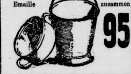
neublau und Emaille grau zusammen 95