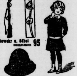
Gewehr u. Säbel 95 zusammen