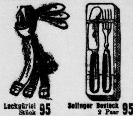
Lackbügel 95 Seltener Bestock 2 Paar 95