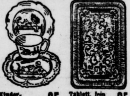
Kinder-Servise 95 Tablett, fein vernickelt . 95