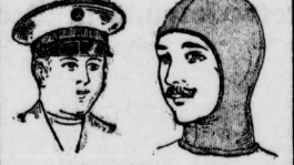
Knab.-Soldaten-Mützen m. Schirm 95 Kopschützer, feldgrau . . . 95