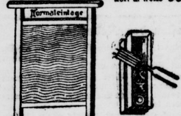
Washbrett 95 Bronscheren-Garnitur 95