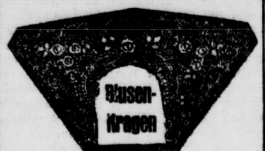
in verschiedenen Ausführungen . 95