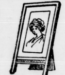
Bilderrahmen in Holz, alle Gröss. 39 Pf.