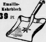
Emaille- Kehrlöch 39 Pf.