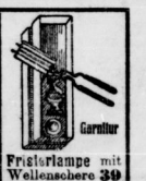
Frusterlampe mit Wellenschilder 39 Pf.