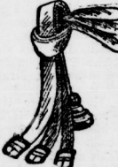
Damen-Gürtel l. mod. Farb., m. eleg. Schliess. 39 Pf.