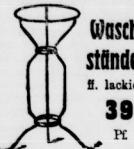
Wasch- ständer ff. lackiert 39 Pf.