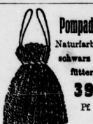
Pompadour Naturfarbe u. schwarz gefürtert 39 Pf.