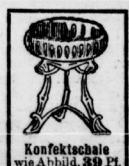
Konfektenschale wie Abbild. 39 Pf.