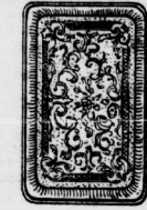
Tablett, ff. verziert 39 Pf.