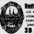
Wandteller mit versch. Ansichten. jetzt 39 Pf.