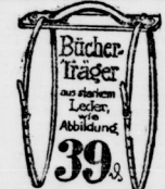
Bücher- träger aus elenium Leder, wie Abbildung 39 Pf.