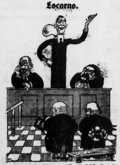
„Das es eine Eitelkeit war, wissen Sie selbst, Sie haben auch ausgeprochen, es nicht wieder zu tun.“

Dieser „Vertrag“ wird hoffentlich... (Text continues with details of the mediation attempt at Hindenburg's residence).