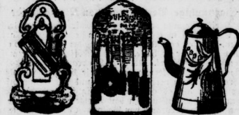
Konsole mit Maß 95 Bürsten-blech 95 Emaille-Kaffeekanne, dek. 95