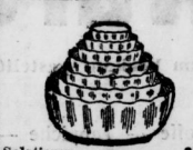
Salatlieren Satz 4 Stück, bunt . . . . . 95