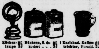
Küchenlampe 95 Büchsen, ff. dek. 95 1 Karibad. Kaffeetrichter, Porzell. 95