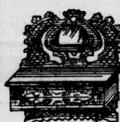
1 geschlitzter Kammkasten . . . . . 95