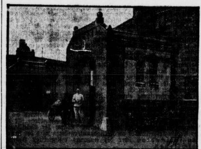
Die beiden Ajyl-Gebäude.