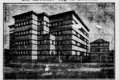
Die Ajylstätten anderer Städte werden nebst auf ihre Dresdener Gegebenheiten bilden, die jetzt ein Danks bekommen haben, dessen Innenraum mit modernsten Einrichtungen versehen sind.

schon 1927 veranlassen. Sie soll zumachen, den 12. März, um 10 1/2 Uhr, in der Aula der Salomonschule stattfinden.