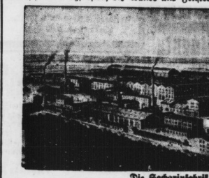
Die Scharnirfabrik in Magdeburg.

Bei dem Unglück handelte es sich um eine Explosion in der Abteilung zur Herstellung von Scharnirpatronen. Die Radiumerzeugung ist für die Herstellung von Radiumkerzen bestimmt.