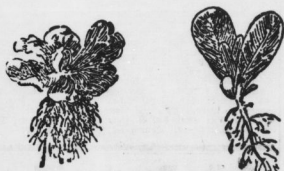
Rechts nicht pikirierte, links vorsetzte Salatpflanze

Frühe Bohnenausäen können ebenfalls gemacht werden, jedoch ist es ratsam, die jungen Pflanzen des Rasch