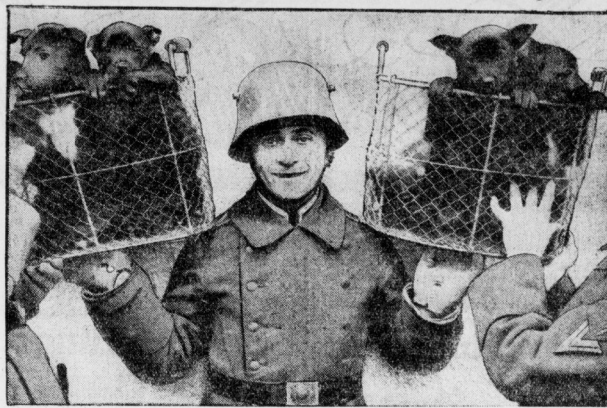
Junge Hölglinge der Beereshund-Anstalt

in Kummerdorf bei Berlin, die dort in einer besonderen Abteilung zu Weidhunden ausgebildet werden, nachdem sich im Weltkrieg vor allem die deutschen Schäferhunde in der Ueberbrückung von Gräben und Melungen besonders zuverlässig erwiesen.