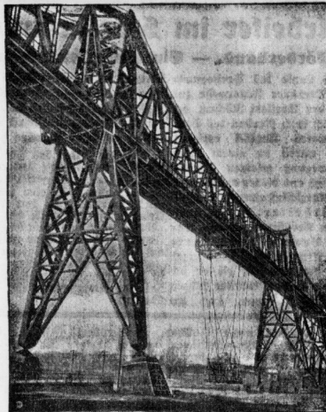
Eine der interessantesten Brückenbauten ist die Bahnbrücke über den Rordorfer-Ranal bei Rendsburg...