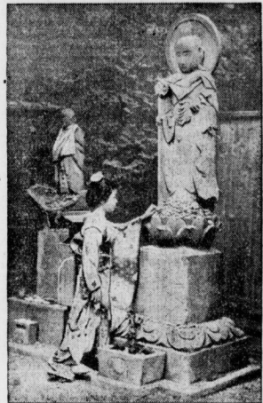
Ein Stück japanisches Religionsleben. Ein junges japanisches Mädchen verrichtet vor einem Gottesbild am Wege ihr Gebet. Nach jedem Gebet fügt sie einen Steinchen zu dem andern.