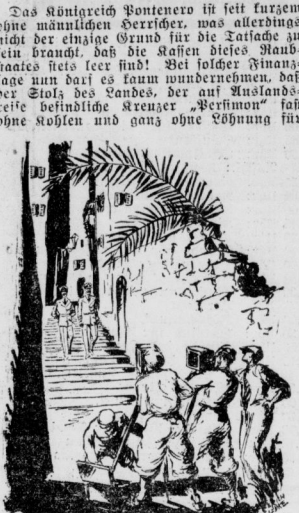
Bei der Tonfilmarbeit in Monte Carlo für den neuen Ufa-Film der Erich Pommer-Produktion "Bomben auf Monte Carlo"