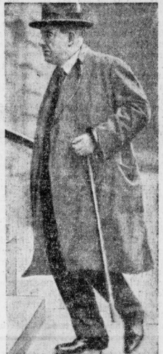
Der Mann des Mittelhandes.