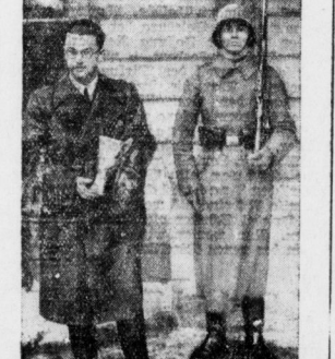
Wolf Hirth nach dem Empfang beim Reichspräsidenten.

Die Reichspräsidentenwahl hat am 12. April, die zweite Runde bis zum 27. April und die dritte Runde bis zum 30. September 1933 erfolgt. Die Reichspräsidentenwahl hat am 12. April, die zweite Runde bis zum 27. April und die dritte Runde bis zum 30. September 1933 erfolgt.