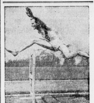
Von den Akademiker-Weitspielen in Turin.