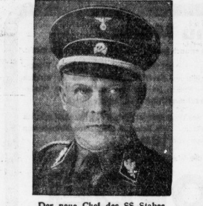
Der neue Chef des SS-Stabs. Gr.-Gruppenführer Seidel-Dittmarsch.

An der Kloster-Seiche hat sich dieser Tage ein ganz seltsames Schauspiel. Ein großer Sechshunde lag am Strand und nuschelte im Seegras, wo er anscheinend nach