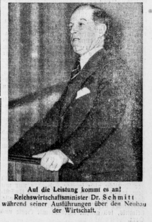
Auf die Leistung kommt es an! Reichswirtschaftsminister Dr. Schmitt während seiner Ausführungen über den Neuaufbau der Wirtschaft.

Dunfle Tufen auf weitem Schnee, wegen sich Teile der Leipziger Garnison in Geländebereich. Wir Reizungsleute sind gekommen, dem zuzuhören und den Felder aufzuweichen, die vielfach noch niemals eine geschlossene militärische Truppe gesehen hat, und die sich von ihren Vätern und Müttern wie aus einer längst vergangenen Zeit berichten lassen muß, was das eigentlich ist, was wir einst waren: Ein Volk in Waffen, ein Volk mit einem Volkssinn, ein Volk, in dem jeder gesunde junge Mensch mindestens ein Jahr lang dem Wehrdienst verpflichtet war, ein Soldatenland, in dem jeder wehrfähige Mann einen Platz hatte, gleichgültig, was Berufes und was Standes er