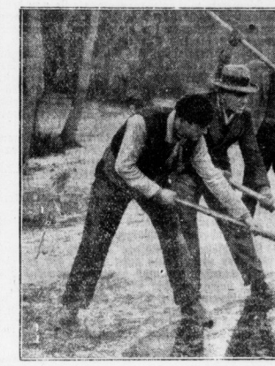
Eisernte im Winter Die Eisdecke wird aufgehacht...