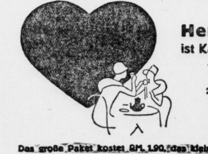
Das große Paket kostet RM. 190,000. 95 Pfennige. Der Kaufmann führt ihn.