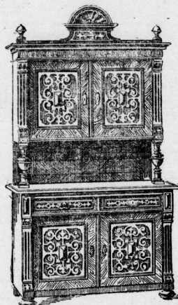
1 aushb. Buffet, innen Eiche, M. 135.

Permanente Ausstellung muster-gültiger Einrichtungen in Chippen-dale, Gothik, Empire etc. etc.