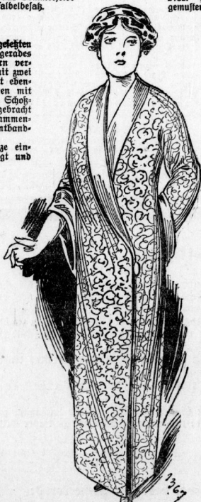
1367. Lofter Schlafrock mit aufgeschöpften Ärmeln für Damen.