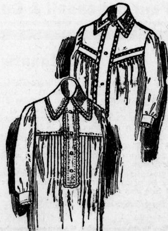
1285 und 1286. Zwei einfache Nachthemden für ältere Damen.

Berzig zugeschnittene Schnittmuster zu sämtlichen Abbildungen