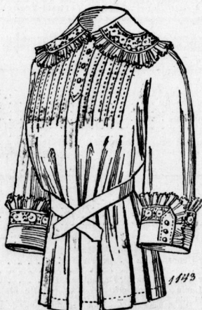
1143. Morgenjacket aus hellblauem Stoff mit buntemustertem Besatz für Damen.

2136 und 2137. Anzug für Knaben und Mädchen. An das kurze eingetragene Mädchenkleid des Mädchenkleides ist die Bluse fest angefügt und