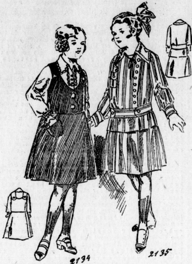
2134. Kleid mit Unterbluse für Mädchen von 9-11 Jahren. 2135. Kleid mit Schößbluse für Mädchen von 11-13 Jahren.

den Damen geltend, die jene sich vom guten Geschmack entfernen den Liebertreibungen der Mode und namentlich der Nahtmode vermeidet und zu der goldenen Mittelstraße zurückkehrt. Mit dem Kürzerwerden der Röcke hat man Einhalt getan, ebenso mit der verführerischen Liebertreibung der Weite. Narfungen und Bauhungen läßt man nur an den gemäßigten Seitenlängern, sehr selten an Stragenlängern. Am noch einmal auf das Blusenhemma zurückzukommen, sei der neuen Mädchenblusen gedacht, die in sehr praktischer Weise für den Sommer diese beiden Kleidungsstücke vereinen. So wurde zu einem grauen Rock eine Mädchenbluse aus grauer Seide mit farbigem Besatz getragen. Das hünenförmige über den Gürtel fallende Mädchen trug vorn eine Bluse in den farbigsten Schärpen-Gürtel, unter dem (nur vorn) eine graue Krage als Schößchen heromrat. Auch weiße farbige Blusen haben zumellen Mädchenform. Man kann dieselbe in einfacher Weise durch eine unten angelegte Spitze, die über den Gürtel fällt, erzielen.