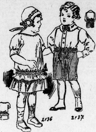
2136. Blusenkleid für Mädchen von 3-4 Jahren. 2137. Knabenanzug für das Alter von 4-5 Jahren.