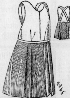
2065. Rock mit Leibchen.