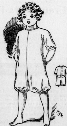
1792. Nachtsachen für Kinder von 2-3 Jahren.

Fertig zugeschnittene Schnittmuster zu sämtlichen Abbildungen