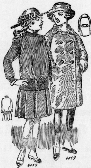
2058. Kleid mit langer Bluse und Faltrock für Mädchen von 10-12 Jahren. 2059. Mantel aus Flaushstoff mit Schulterärmeln für Mädchen von 11-13 Jahren.

2062. Sackanzug für Damen. Mit der locken, durch einen Gürtel zusammengehaltenen Jade ist ein Faltrock zusammengestellt. In diesem sind die vordere und rückwärtige Bahn