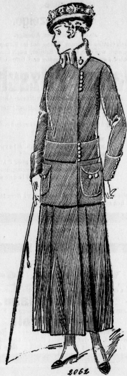
2062. Anzug mit Hürtelacke und Faltrock für Damen.