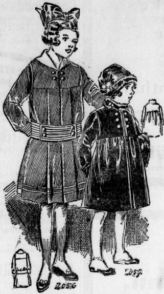
2056. Kleid mit Puffenbluse für Mädchen von 9 bis 11 Jahren. 2057. Mantel mit Puffe aus Samt für Mädchen von 4-6 Jahren.