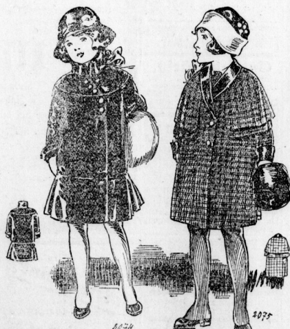
2074. Wintermantel aus braunem Plüsch für Mädchen von 7-9 Jahren.