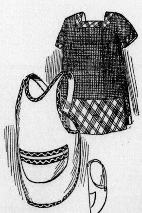
1857. Hängerschürze mit angehängten Nermeln aus glattem und kariertem Stoff für Kinder von 3-5 Jahren. — 1858. Spielschürze aus naturfarbendem Leinen mit totem Tüchlein für Kinder von 3-5 Jahren.

Fertig zugeschnittene Schnittmuster zu sämtlichen Abbildungen in den Normalgrößen 42, 44 und 46, für Kinder in den angegebenen Altersstufen, sind zum Preise von je 35 Pf. durch unsere Geschäftsstelle zu beziehen.