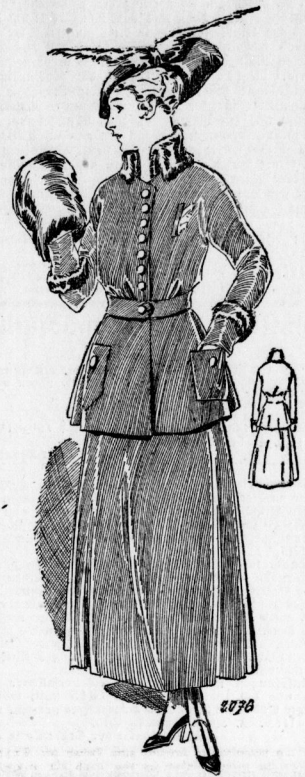
2076. Anzug mit einfachem Glockenzock und Schößjacket für Damen.