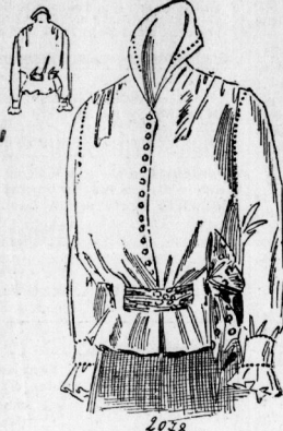
2078. Nachmittagsbluse aus weißer Seide mit Schößchen.