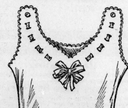
1930. Glattes Damenhemd mit Bogenrand und Banddurchzug.