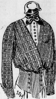
2069. Bluse aus kariertem Seide mit hellem Einfaß und schwarzer Kravatte.