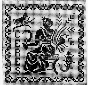
Dreiecksmuster für Kreuzstichterei oder Filzdruck. Ceres darstellend.

Fertig zugeschnittene Schnittmuster zu sämtlichen Abbildungen in den Normalgrößen 42, 44 und 46, für Kinder in den angegebenen Altersstufen, sind zum Preise von je 35 Pf. durch unsere Geschäftsstelle zu beziehen.