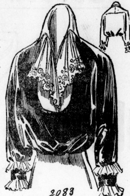
2083. Daschliffagablu, aus dunkeltem Samt mit hellem Besatz für Damen.