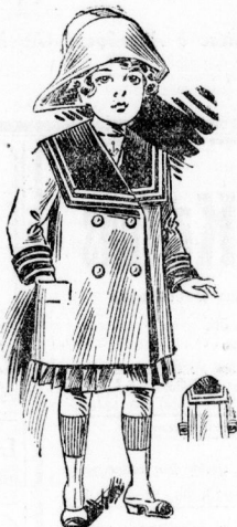
2002. Mantel aus rotem Wollstoff mit Marolinenkragen für Mädchen von 5-7 Jahren.