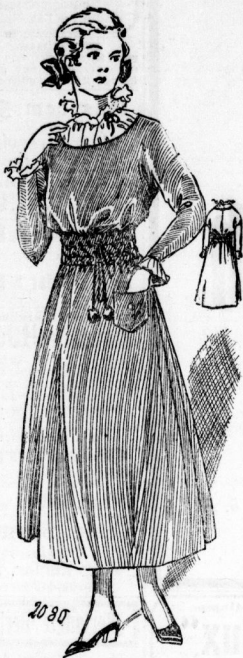
2080. Kleid mit eingekauftem Rock und hellem Einfaß für Mädchen von 14-16 Jahren.