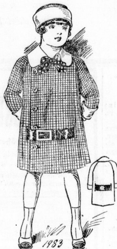
1983. Lofler Knabenmantel mit Quilterärmeln und Laßgürtel für das Alter von 5-6 Jahren.