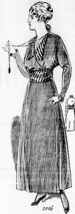
2086. Einfaches Damenkleid mit absteifendem Besatz, Glodenrock.