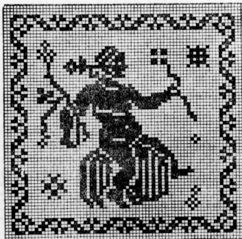
Dreiecksmuster für Kreuzstichterei oder Filzdruck. Amor darstellend.

Sowas gewundene Stoffe zu reinigen. Manche schwarzen Stoffe, namentlich Tuch, nehmen leicht einen ledigen Glanz an. Um diesen zu entfernen, legt man auf die glänzende Seite ein leuchtendes Leinentuch, über das man einigemal schnell mit dem heißen Eisen fährt, doch so, daß man das Tuch dabei nicht trocken plättet. Dann nimmt man es fort und klopf, während der Stoff noch dampft, diesen so lange mit einer weichen Bürste, bis das Dampfen aufgehört. Der Spedglanz wird dann auch verschwinden sein.