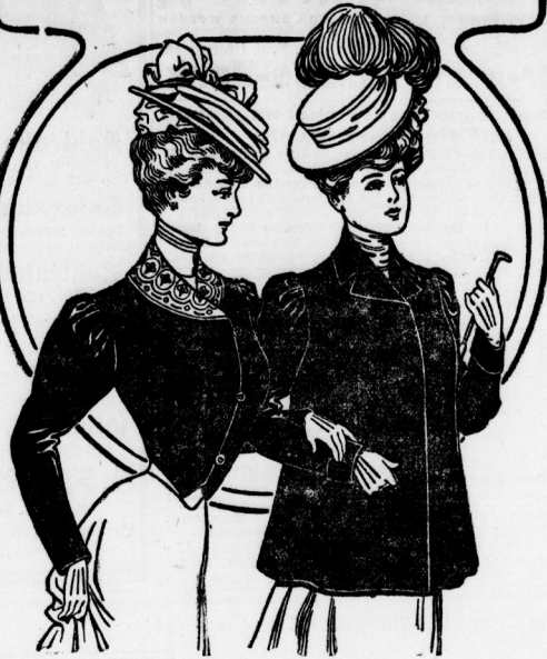
empfiehlt so lange Vorrat