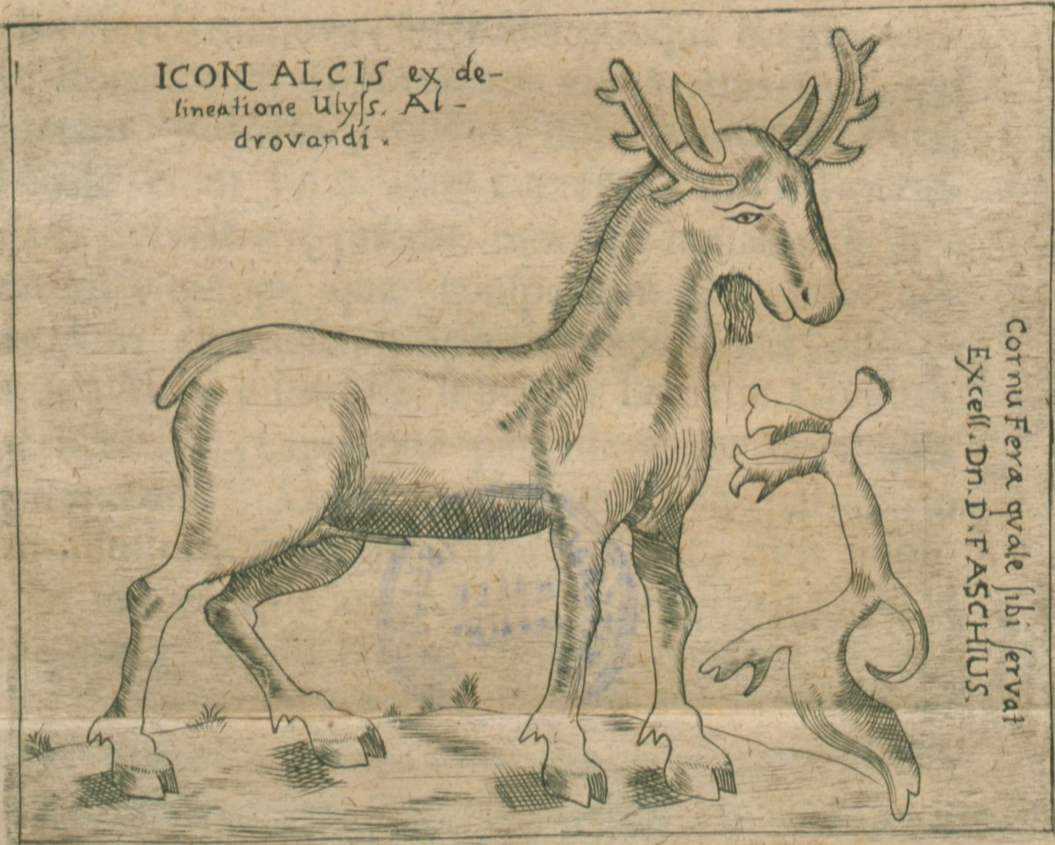
Cornu Fera quæ sibi servat Excell. Dn. D. F. ASCHIIUS.