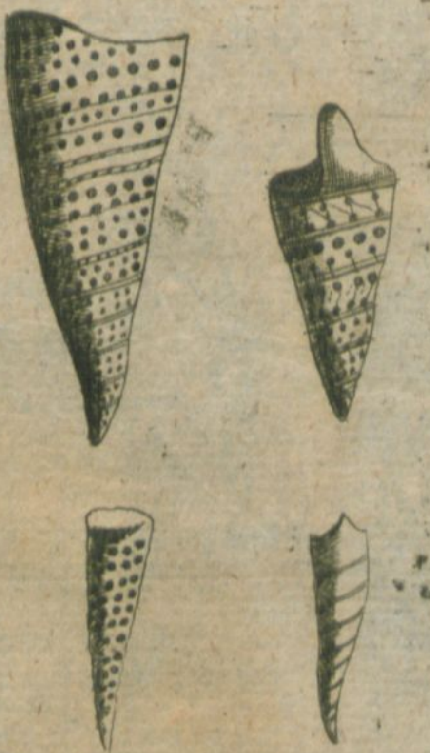
Glossopetra Honheimenses et Alzeiensis