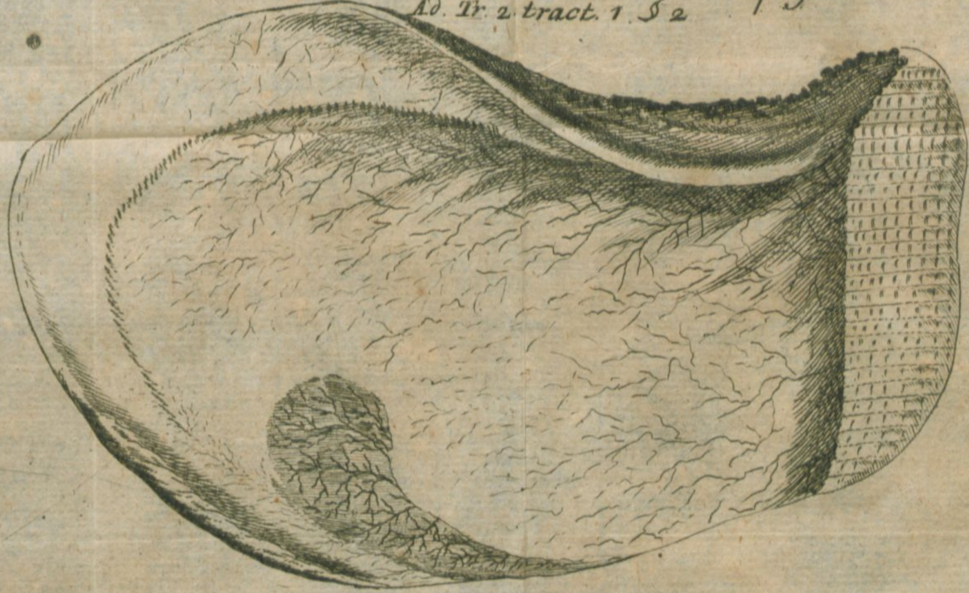
Aterum gen. Concharum ostracearum Alzeiensium Ad Tr. 2 tract. 1 S 2