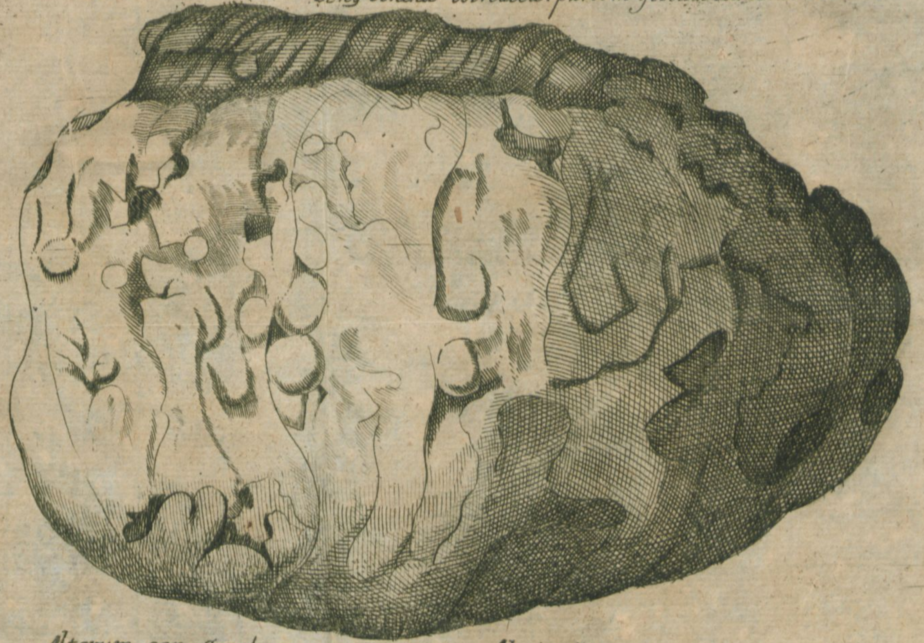
Aterum gen. Concharum ostracearum Alzeiensium Ad Tr. 2 tract. 1 S 2