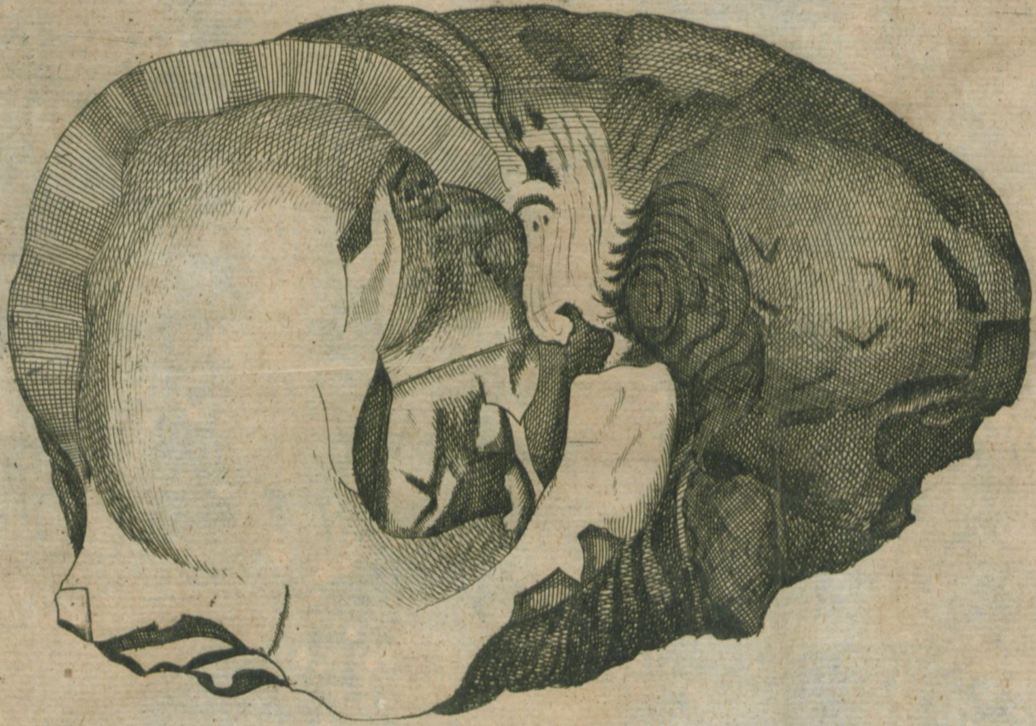
Genus Concha Ostraceae partem simā exhibens