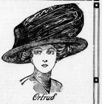
Grosse Rembrandtform aus engl. Geflecht garnitur, Samt-u. Goldknöpfen garn. Stück 7 M. 75