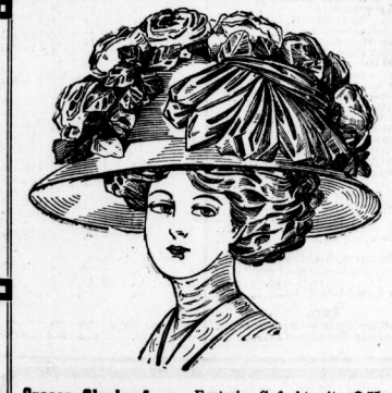
Grosse Glockenform. Fantasie-Geflecht mit elegant, Rosenranke. reich. Seidenband-Garn. Stück 15,75, 12,75, 9,75 M.

Geschäftshaus J. Lewin Halle a. S., Marktplatz 2 u. 3.