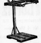
Sackaufhänger, Sackheber, Binden, Gluckensacke liefert Bella 80. 16. Könnigerstraße 71.