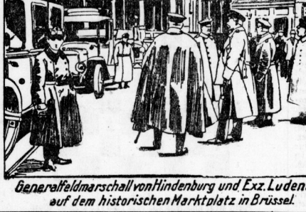
Generalfeldmarschall von Hindenburg und Ex-Ludendorff auf dem historischen Marktplatz in Brüssel.