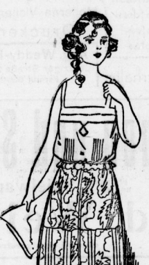
3. Praktisches Jungmädchenkleid aus gestreiftem und einfarbigem Stoff.

2. Reizendes Pierrefenokostüm aus dunkel bemalter Seide mit schwarzem Seidenmieder. Das kommt ein weißes Batisthemden und weiße Fäule. Arms- und Halsbänder aus schwarzem Samtband.