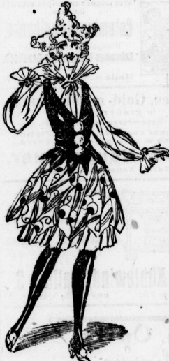
2. Reizendes Pierrefenokostüm aus dunkel bemalter Seide mit schwarzem Seidenmieder.

ist wie zu groß gearbeitet, er wird nicht eher mal durch die Ohren ausgefallen. Der französischen Mode entsprechend kommen auch die schwarzen Plumpen Stoffhüte in Aufnahme, die trausermäßig erscheinen, und setzen ein Glanzlicht in Gestalt von Kadoband oder einer Einfassung aus Zetteln ein erhalten. Ein solcher Hut zum schwarzen Kostüm getragen, sieht zwar sehr distinguiert aus, hat aber bei uns kein größeres Publikum gefunden. Viel mehr Gefallen finden unsere Damen an den großen glänzenden Zylinderlampe- und Pannehüten, die außerdem noch mit glitzerndem Fetz oder einer farbigen kleinen Straußgarnitur aufgebeizt sind. Die großen Kleideramen Formen, deren Garnitur fast immer rückwärts ist, vielfach weit über den Rand fallend, werden am meisten gekauft. Bis auf die Schulter reichen sich die ägyptischen Straußfedern oder die Bandschluppen. Aber kein Hutdamant macht sich so breit wie der Schleiter, dem gestattet ist, einem Schal gleich, die Gehärt von hinten einzuwickeln. Gold- und Silberbesätze häufig auf farbigen Grund, werden zu diesem Zweck die beste Wirkung ergeben.