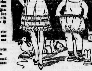
7. Prinzesshütchen für kleine Mädchen mit Seidenamt.

11. Babyhüte aus Flanell mit weicher Sohle und Bandverschluß.