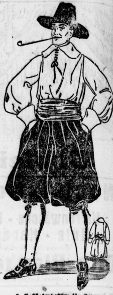
3. Holländerkostüm für Herren nach altem Vorbild.

4. Spielhütchen für kleine Kinder mit Samming aus weißem oder dunklem Flanell. Das Kind besteht aus gebräuntem weissen Leinen. Dazu trägt der Mann eine breite, rote oder schwarze Schärpe und ebenfalls schnitzendes. Der Hut wird man sich am besten leisten.