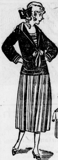
4. Praktisches Jungmädchenkleid aus gestreiftem und einfarbigem Stoff.

ist wie zu groß gearbeitet, er wird nicht eher mal durch die Ohren ausgefallen. Der französischen Mode entsprechend kommen auch die schwarzen Plumpen Stoffhüte in Aufnahme, die trausermäßig erscheinen, und setzen ein Glanzlicht in Gestalt von Kadoband oder einer Einfassung aus Zetteln ein erhalten. Ein solcher Hut zum schwarzen Kostüm getragen, sieht zwar sehr distinguiert aus, hat aber bei uns kein größeres Publikum gefunden. Viel mehr Gefallen finden unsere Damen an den großen glänzenden Zylinderlampe- und Pannehüten, die außerdem noch mit glitzerndem Fetz oder einer farbigen kleinen Straußgarnitur aufgebeizt sind. Die großen Kleideramen Formen, deren Garnitur fast immer rückwärts ist, vielfach weit über den Rand fallend, werden am meisten gekauft. Bis auf die Schulter reichen sich die ägyptischen Straußfedern oder die Bandschluppen. Aber kein Hutdamant macht sich so breit wie der Schleiter, dem gestattet ist, einem Schal gleich, die Gehärt von hinten einzuwickeln. Gold- und Silberbesätze häufig auf farbigen Grund, werden zu diesem Zweck die beste Wirkung ergeben.