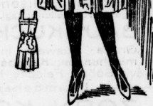
5. Reizendes Pierrefenokostüm aus dunkel bemalter Seide mit schwarzem Seidenmieder.