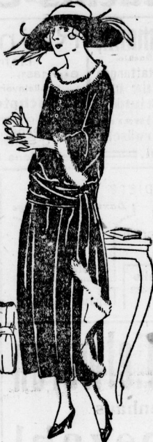
1. Elegantes Kleid aus grünem Baumwolltamt.

Der erste Schmerz, den uns die Anschaffung des neuen Winterhutes in Bezug auf die Gesundheit meistens bereitet hat, ist wohl der. Da aber die Frauen in Verbindung von Sämereien und Keiden viel widerstandsfähiger sind als die Männer, so gehen sie sehr bald mit neuem Mut an die Erhebung des zweiten Hutes. Die Saison ist schon weit genug im Gange, und in kaum sechs Wochen feiern wir Weihnachten. Inzwischen hat sich die Hutmode weiter entwickelt, und immer mehr setzt sich eine Vorliebe für weiche Linien und unregelmäßige Drapierung. Der kleine Laufhut, wie der große Abendhut, haben aber als erste Verpflichtung, das Gesicht zu bedecken. Schon vor einem Jahr glaubten wir nicht, daß man den Hut noch tiefer auf die Stirn drücken könnte. Jetzt sieht man aber solche Frauen, deren Hutrand nicht einmal mehr die Augenbrauen sichtbar werden läßt. Der Hut