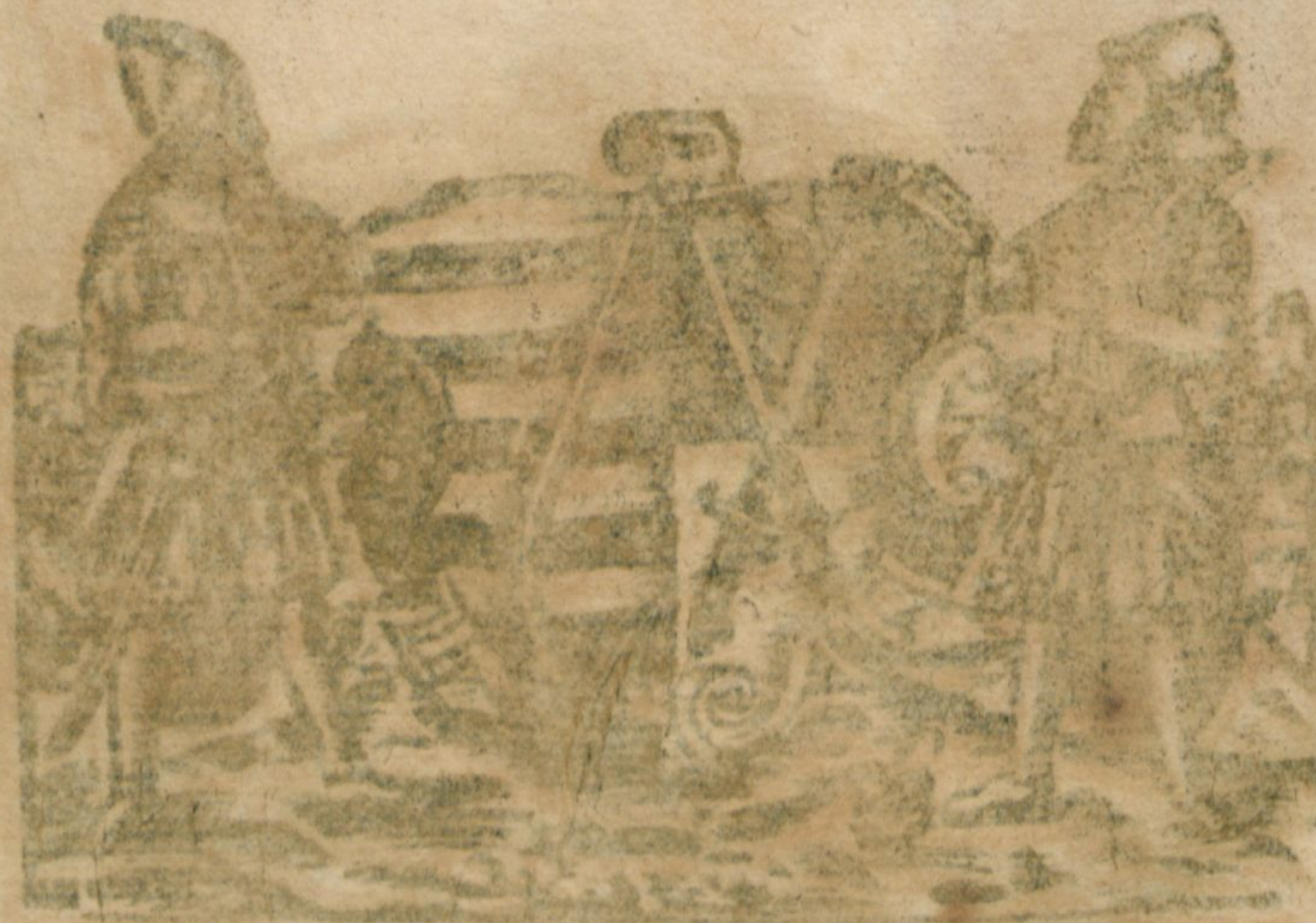
Die Kunst der Buchdruckerei