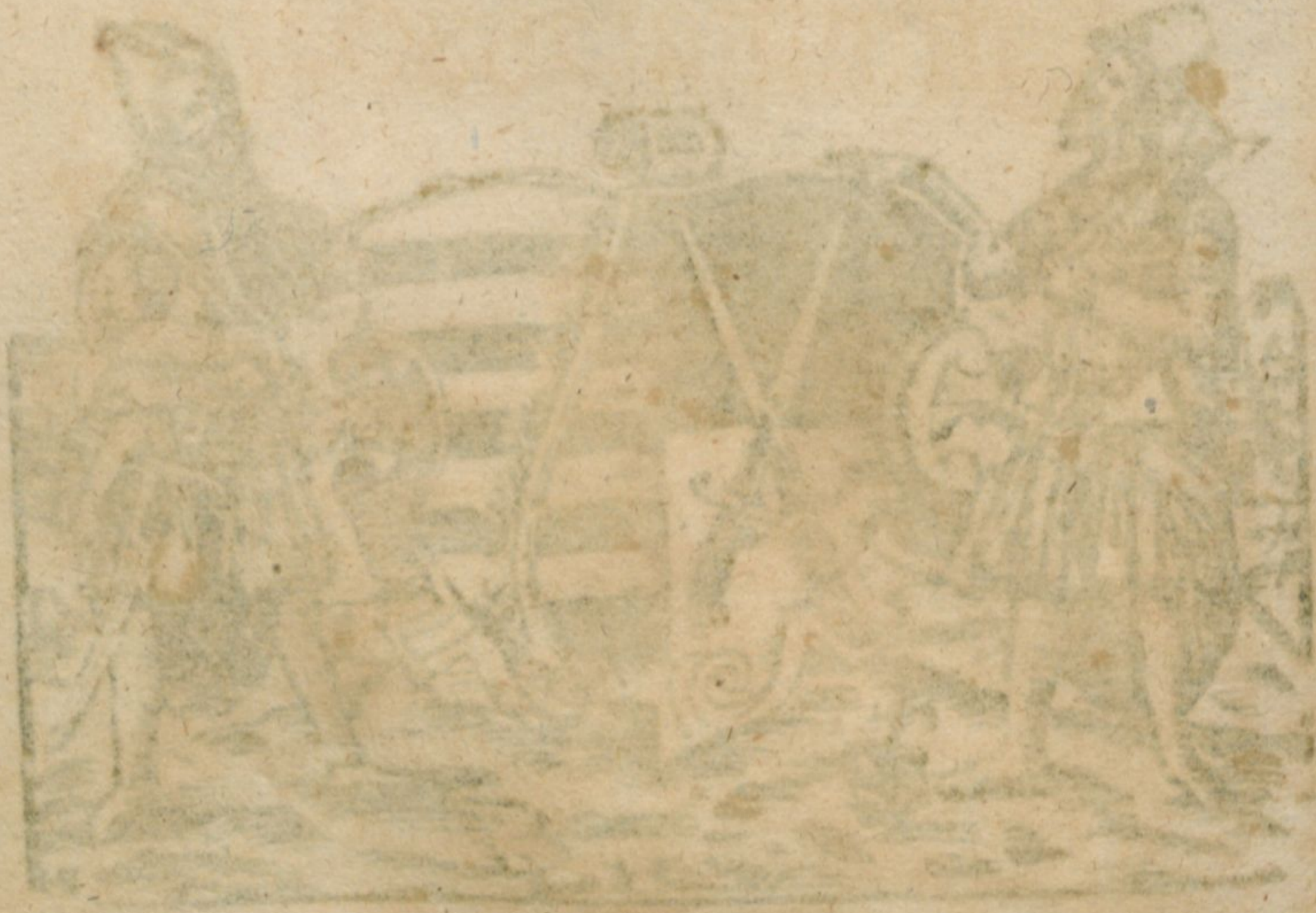
Die Kunst der Buchdruckerei