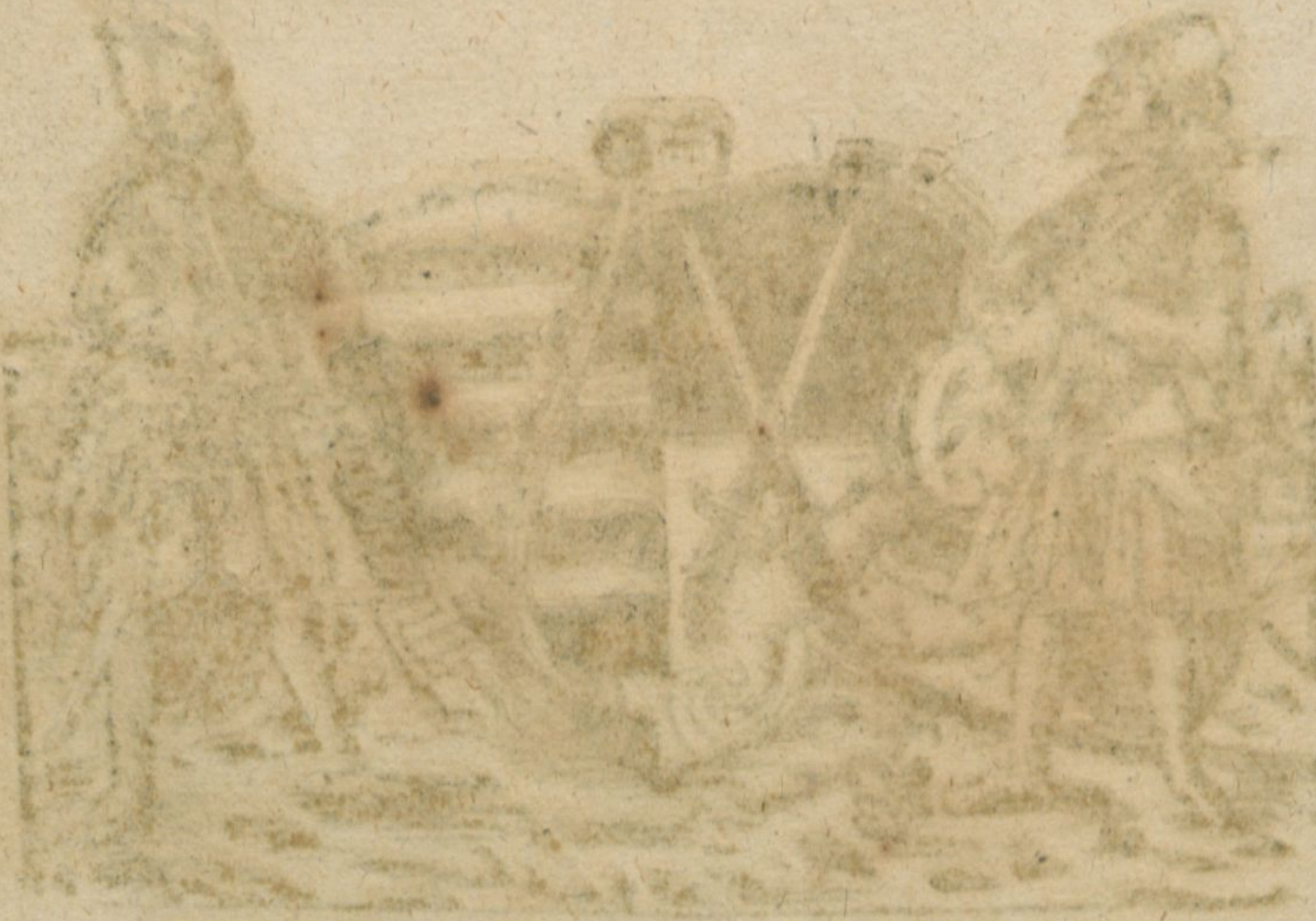
Die Kunst der Buchdruckerei

Die Kunst der Buchdruckerei ist eine von den ältesten und wichtigsten Künsten der Menschheit. Sie hat nicht nur die Verbreitung der Wissenschaften und Künste ermöglicht, sondern auch die Entwicklung der menschlichen Geistigkeit gefördert. In der Buchdruckerei wird die Sprache festgehalten und über die Grenzen der Zeit und des Raumes verbreitet.