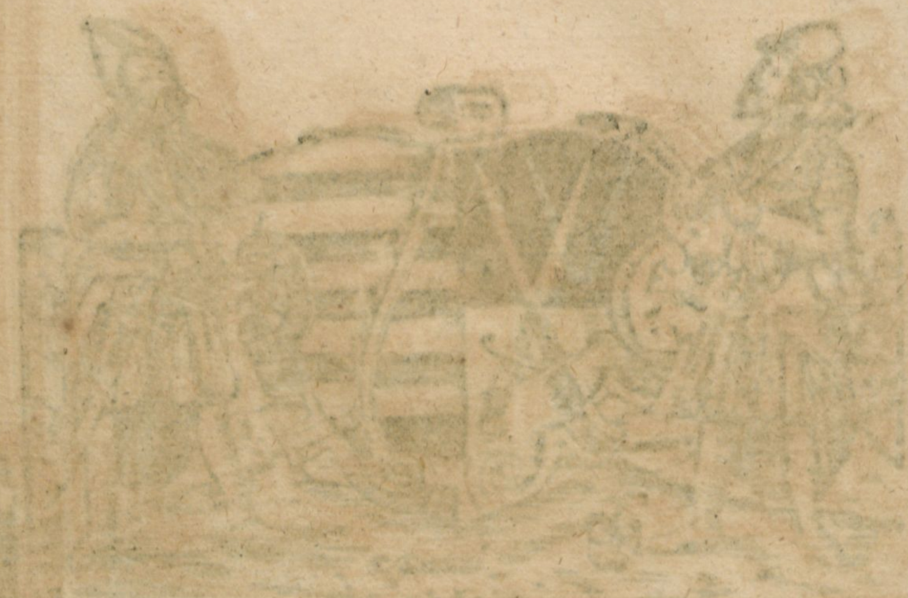
Die Stadt Magdeburg im Jahr 1500