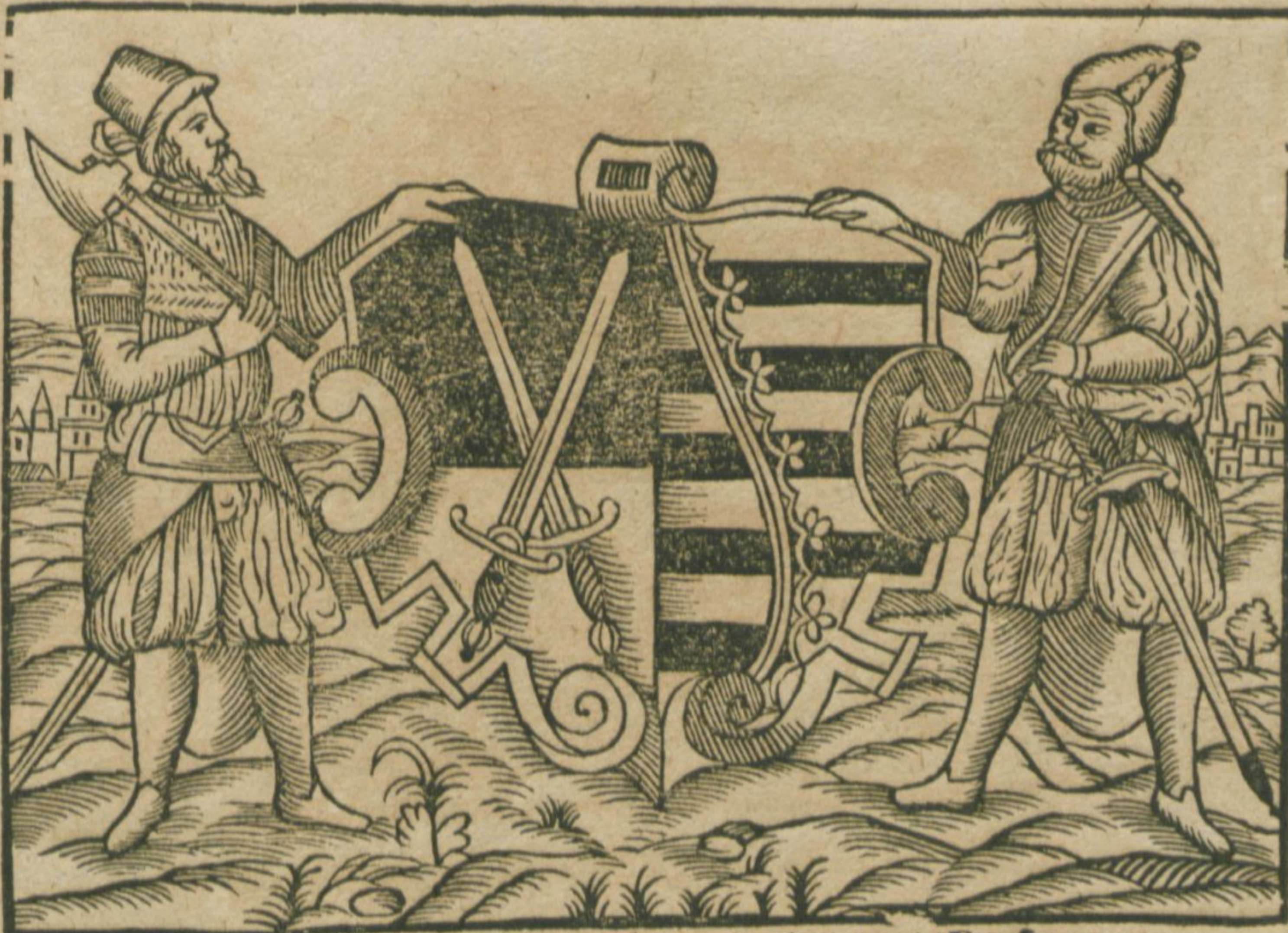
Georuckt zu Freyberg bey Zacharias Beckern.